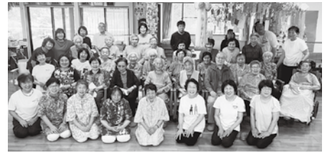
鶴巣桜の家お楽しみ会