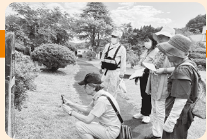
宮床のお宝候補を見学・取材中！

今年度に入って吉岡・宮床・吉田の3地区では、「地域が元気になるための話し合いの場」＝協議体が進んでいます。各地区でどんな話が進んでいるのか、ご報告します！