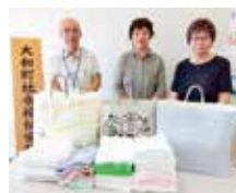
くろかわ商工会女性部様