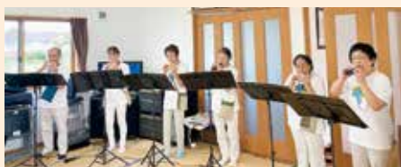
オカリナ万葉 ハーモニー