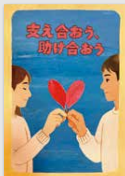
小学生の部最優秀賞