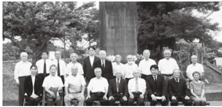
大和町遺族会宮床支部慰霊献花式