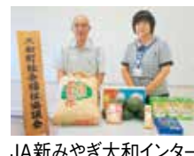
JA新みやぎ大和インター 富谷支店様