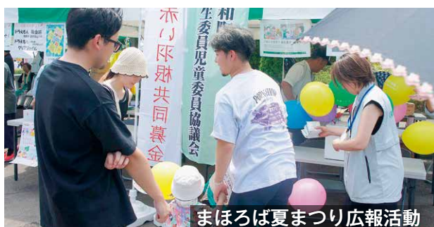
まほろば夏まつり広報活動