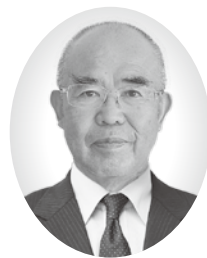
大和町社会福祉協議会 会長