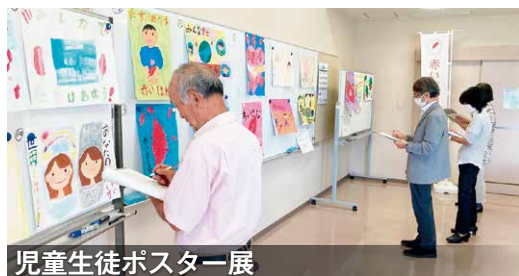
児童生徒ポスター展