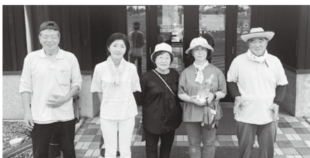
パークゴルフ交流会