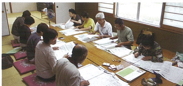
▲宮床地区民生委員児童委員のマップ作成の様子