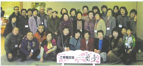
▲避難者19人、ボランティア14人 計33人が参加しました。

東日本大震災により避難されている皆さんの交流サロン「ようこそ大和町へ！」では11月18日(月)晴天の中、秋保温泉蘭亭へ移動して交流会をしました。参加者から三味線や踊りや歌の披露があったり温泉に入ったり、いつもと違う交流会で参加者にはほっこり笑顔が見られました。「毎月みんなと会えることを楽しみにしています。一人で温泉に行くことはないのだから今日はみんなと一緒にとっても嬉しいです。」と喜んでいただきました。