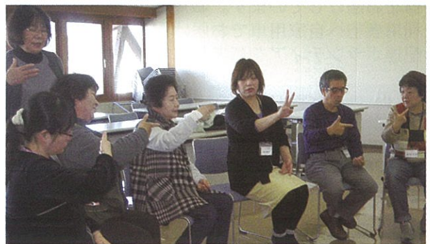
▲「手の向きはどっちかな？」身ぶり手ぶりで大奮闘

受講者からは「とても楽しかったです。終了証も頂けてとてもうれしいです。」「初めは何が何だかわからなかったのですが、回を重ねるごとに少しずつ分かるようになりました。」「災害時に役立てるよう頑張りたいと改めて感じました。」「毎回楽しく習うことができました。これからも続けたいと思います。」などの感想が聞かれました。